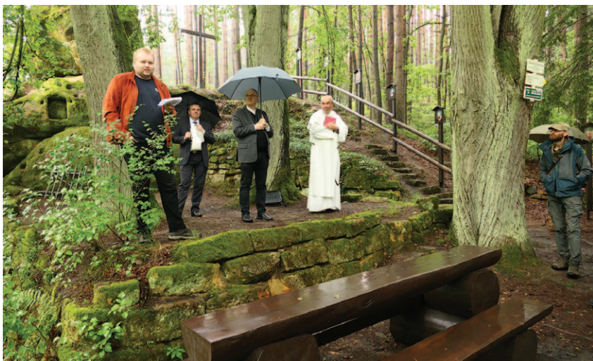
Slavnostní vysvěcení Janovických poustev 1. června 2024

Na jejich počest byla k poustevnám v roce 1834 uspořádána první pouť, při které bylo místo i vysvěceno. Křížová cesta včetně jeskyně zde byla vybudována pravděpodobně po roce 1864 majitelem pozemku Antonem Rudolphem. V roce 1912 bylo místo obnoveny, ale tradice poutí rychle slábla a definitivně se vytratila s vystěhováním většiny německy mluvících obyvatel Janovic. Místo upadlo v zapomnění, obrázky zmizely nebo byly zničeny.