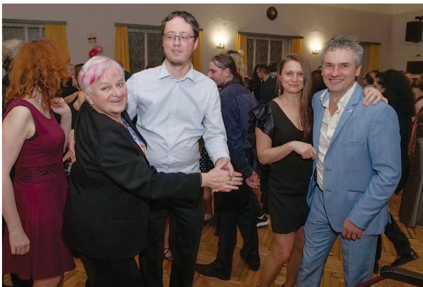
Tradiční spolkový ples opět v sále U Košků

Tradiční ples JJHS proběhl v restauraci U Košků v Liberci – Nových Pavlovicích dne 16. února 2024 od 20 hodin. K tanci i poslechu zahrála kapela Anex a program obohatilo i vystoupení bubenické skupiny Carnaval.