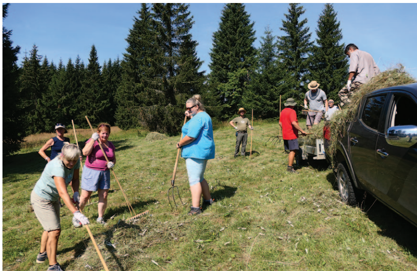
Hrabání a odvoz biomasy z Pralouky na Jizerce

V rámci akce se pokračovalo v zajímavém projektu pracovníků Správy CHKO Jizerské hory, kteří na vytípané ploše chudé louky provádí pokus zvýšení druhové diverzity pomocí rozprostírání sena z druhově bohatších luk. Louka se nejprve poseče, odstraní se travní hmota, následně se narušuje travní drn, aby semena měla větší šanci se uchytit a posléze se rozprostírá rovnoměrná menší vrstva sena. Posekání louky se nahrazuje také