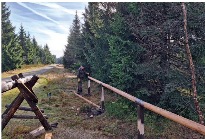
Údržba zábradlí v PR Na Čihadle

Zejména v praktických opatřeních pro ochranu přírody rozšířil JJHS svoji působnost na téměř celé území Libereckého kraje. Svoji činnost zaměřujeme především na práci v terénu, na péči o chráněná území v Jizerských horách, na Ještědském hřbetu, v Českém ráji, Lužických horách, na Frýdlantsku i Českolipsku. Vyznačujeme hranice rezervací, kosíme horské louky se vzácnými druhy rostlin, likvidujeme nepůvodní invazní rostliny, vytváříme nové biotopy pro vodní a mokřadní faunu i flóru, budujeme a udržujeme zařízení k usměrnění pohybu návštěvníků, stavíme oplocenky k ochraně lesních porostů apod. V posledních letech se podílíme na revitalizaci vybraných rašelinišť v Jizerských horách hrazením odvodňovacích příkopů, které zde byly v minulosti vytvořeny.