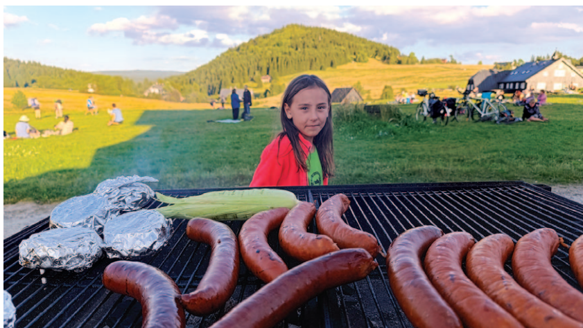
Voňavé klobásy – oblíbená pochoutka návštěvníků i na akci Den a noc na Jizerce