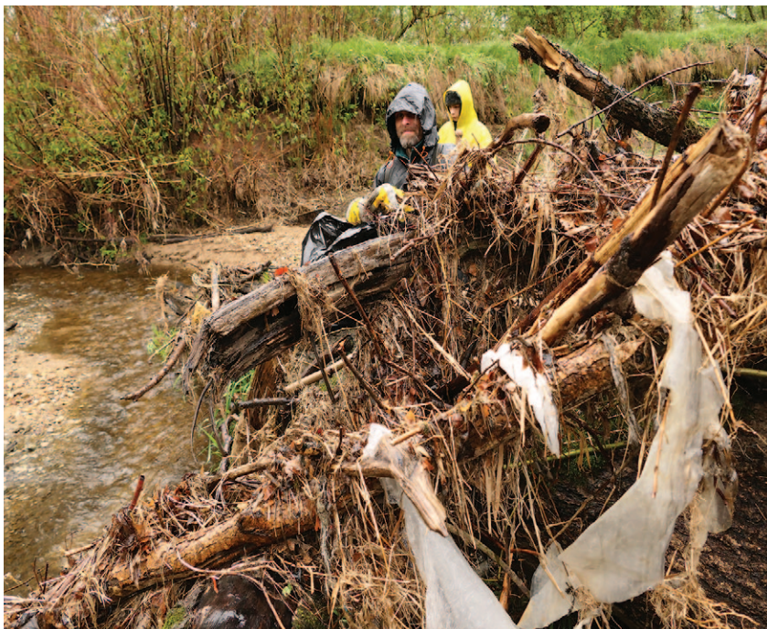
Úklid PR Meandry Smědě