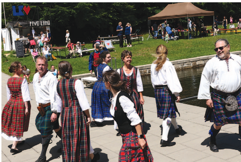
T. O. Jizerský bodlák na Slavnostech slunovratu na Lesním koupališti 22. června 2024