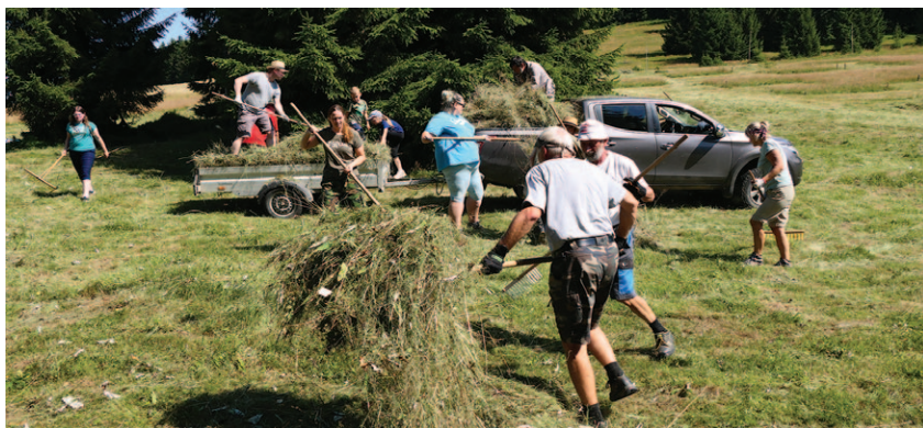
Hrabání a odvoz trávy z Pralouky na Jizerce

Pozemkový spolek pro přírodu a památky severovýchodních Čech, původně nazvaný Severák, byl založen v roce 2000 jako součást Jizersko-ještědského horského spolku. V červnu 2001 získal do pronájmu první pozemek na Václavíkově Studánce, který již v portfoliu Severáku není, a v dubnu 2002 byl akreditován ÚVR ČSOP a zařadil se tak mezi registrované pozemkové spolky v ČR. Hlavním posláním pozemkového spolku JJHS je přímá ochrana vybraných lokalit s významnou přírodní či kulturně-historickou hodnotou. Tato ochrana je prováděna nejprve nabytím vlastnických nebo jiných věcných práv ke zvoleným nemovitostem (dlouhodobý pronájem) a následnou odpovídající péčí o ně. Severák má aktuálně na starosti tři lokality, tj. pozemek v Kořenově, komplex mokřadů a vlhkých luk v Bílém Potoce a cennou louku zvanou Pralouka v osadě Jizerka.