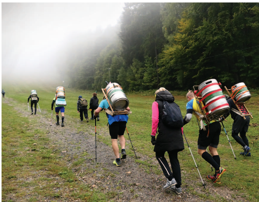
Závody ve vynášení sudů piva na vrchol Ještědu, závodníci těsně po startu